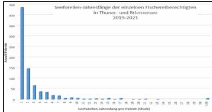
Verteilung der Seeforellen-Jahresfänge in den Berner Gewässern von 2019-2021

Redaktion Geschäftsstelle BKFV Wankdorffeldstrasse 102, Postfach, 3000 Bern 22, Tel. 031 330 28 03 bkfv@kompetenzzentrum-fischerei.ch Erscheinung 4 x jährlich Auflage 5900 Ex. Layout/Druck Lüthi Druck AG, 3360 Herzogenbuchsee