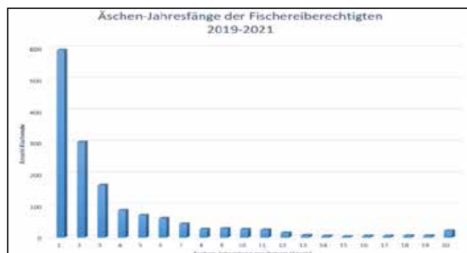
Verteilung der Äschen-Jahresfänge in den Berner Gewässern von 2019-2021

Une limite de capture annuelle pour les truites lacustres est régulièrement réclamée. Du point de vue des prélèvements, elle aurait, de même que son équivalent pour les ombres et les truites de rivière, un