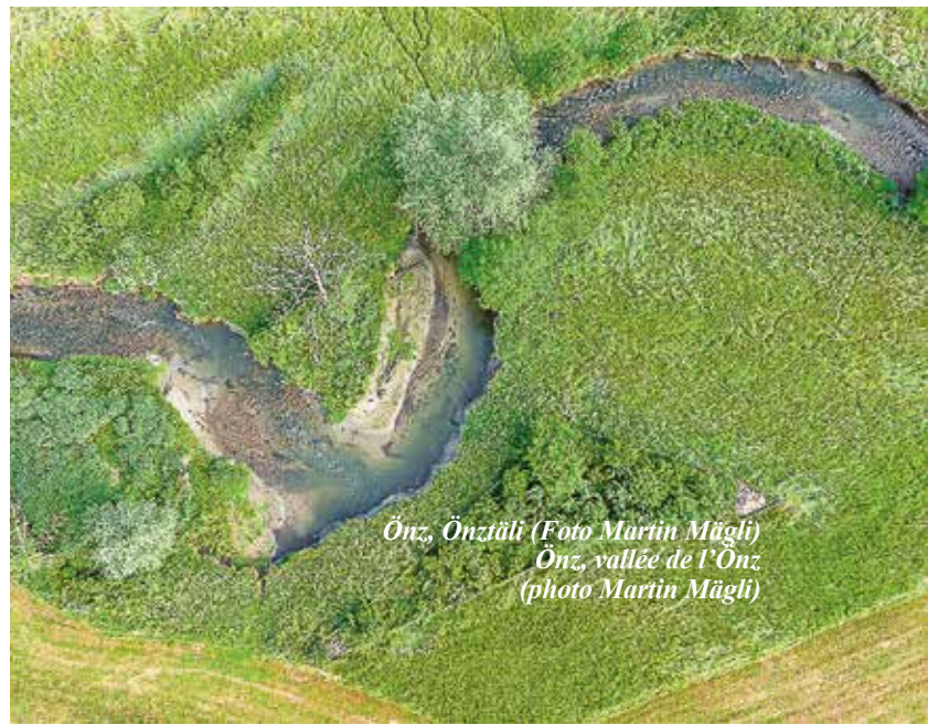
Önz, Önztäli Önz, vallée de l'Önz

25 ans et quelque 1400 projets soutenus plus tard, le FRégén est un modèle de réussite et son action est plus nécessaire que jamais compte tenu des évolutions climatiques annoncées et de l'état des rivières et des ruisseaux, qui reste trop souvent médiocre en termes de morphologie et de qualité de l'eau. La canicule de l'an dernier nous a donné un avant goût de l'été moyen à venir, montrant de façon accablante que la pression sur nos eaux va augmenter et où se situent les déficits. Le manque d'ombrage a fait bondir la température de nombreux cours d'eau, ce que nos espèces amatrices de fraîcheur, comme la truite de rivière ou l'ombre, n'ont pas du tout apprécié. Un peu partout, l'absence prolongée de précipitations a entraîné des niveaux très bas, voire l'assèchement complet des ruisseaux, une situation que certains n'avaient jamais connue auparavant.