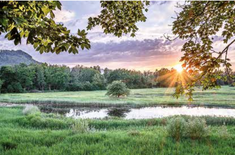
Hechtenloch, Rubigen

Schaffung eines Renaturierungsfonds mittels Volkswille an der Urne nur geringe Chancen zugeschrieben.